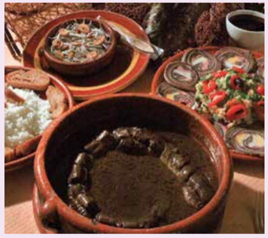
Préparations de lamproie