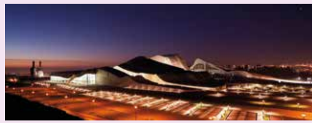
Cité de la Culture, Saint-Jacques de Compostelle

Lors de votre pèlerinage sur le Chemin Portugais, vous aurez vu à l'horizon certaines des îles qui constituent le Parc National des Îles Atlantiques. Du sud au nord : Cies, Ons, Sálvora et Cortegada. Toutes peuvent être visitées. La nature y est unique et les plages et les forêts (comme celle de laurier de Cortegada, la plus grande d'Europe) extraordinaires.