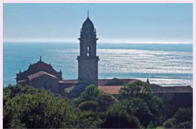
Santa Maria de Oia

La vallée d'O Rosal se trouve à l'embouchure du fleuve Miño, à la frontière avec le Portugal. Allez connaître ses vins avec appellation d'origine, frais, légers et fruités (élaborés avec des raisins des variétés albariño, loureiro et caíño blanco), dont la culture remonte au XII e siècle. Précisément, le monastère de Santa Maria de Oia, par lequel vous êtes passé en faisant le Chemin, bâti face à la mer, est l'origine de ces vignes. Une visite est obligatoire à l'un des chais qui se trouvent en amont du fleuve.