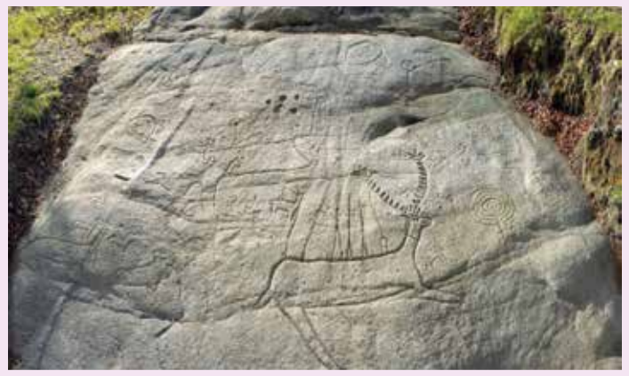
Lake dos Carballos, Parc Archéologique de Campo Lameiro

Pour les amateurs d'art préhistorique, l'intérieur de la province de Pontevedra est toute une découverte : on y trouve une des plus grandes concentrations de pétroglyphes d'Europe, surtout dans les régions de Val do Lérez, Baixo Miño et dans les environs de Vigo. Les pétroglyphes sont des gravures sur pierre d'une ancienneté de quatre à cinq mille ans. Beaucoup ont été découvertes et étudiées récemment. À Campo Lameiro, se trouve le Parc Archéologique d'Art Rupestre : 22 hectares avec de nombreux pétroglyphes d'une grande valeur. L'espace comprend la reproduction d'un village de l'Âge de Bronze. À A Guarda, se dresse le castro de Santa Trega, tout un symbole du nord-ouest ibérique, un village galai-romain avec un sentier de randonnée pour couronner le sommet et atteindre le musée archéologique.