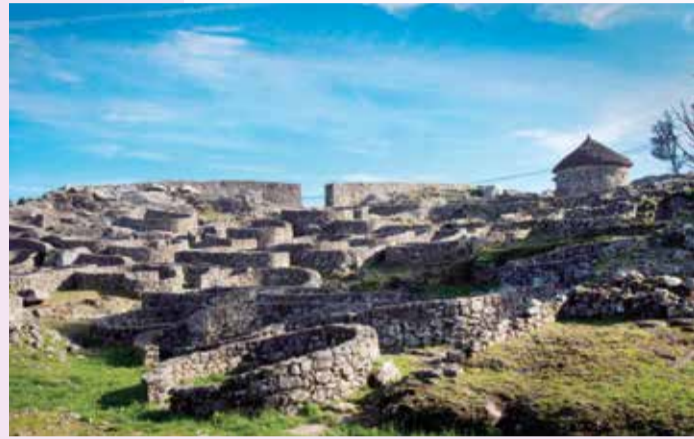
Castro de Santa Trega, A Guarda

Vous voici arrivé à Compostelle. Le moment est venu de garder vos chaussures de marche et de vous convertir en un voyageur curieux, sensible et actif. Retournez sur vos pas. Tout ce que vous avez pu voir ou dont vous avez pu profiter sur votre route vous attend. D'autres chemins s'ouvrent à vous, tout aussi séduisants. Regardez tout ce que nous avons préparé pour vous.