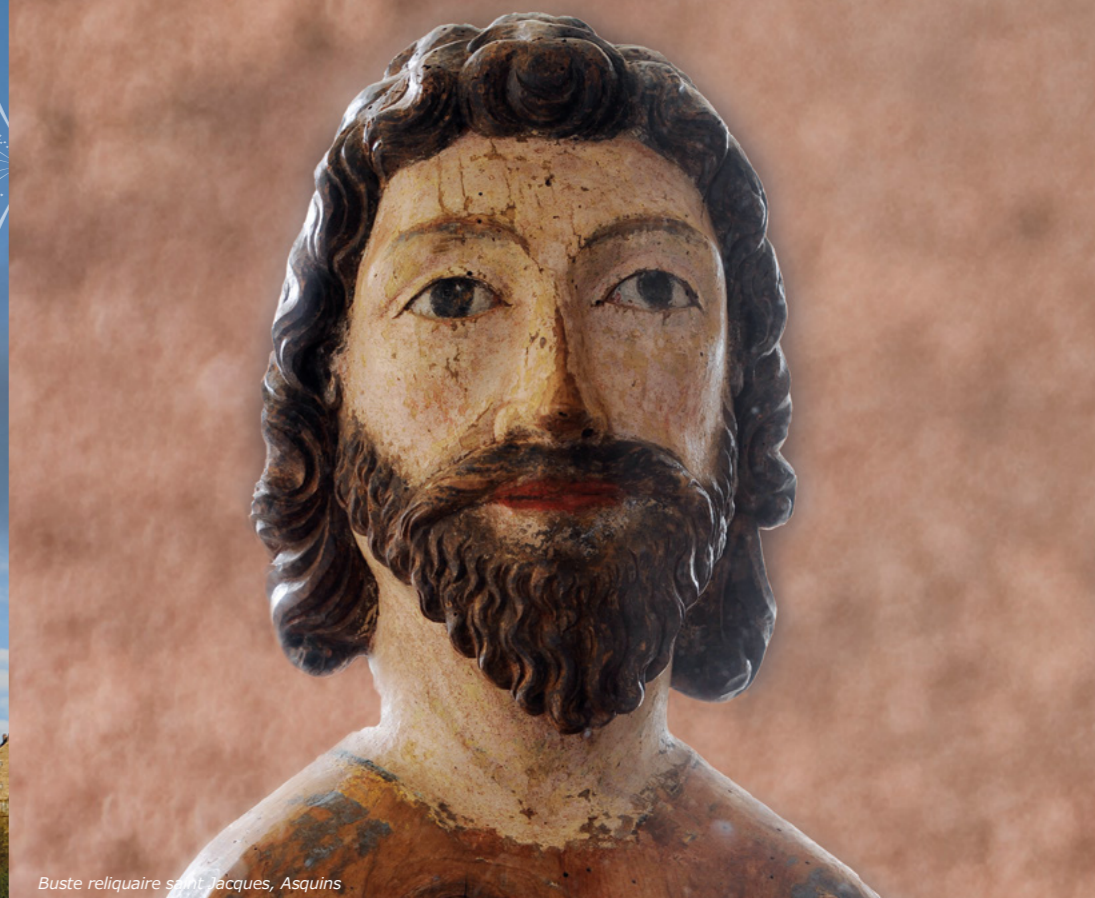
Buste reliquaire saint Jacques, Asquins