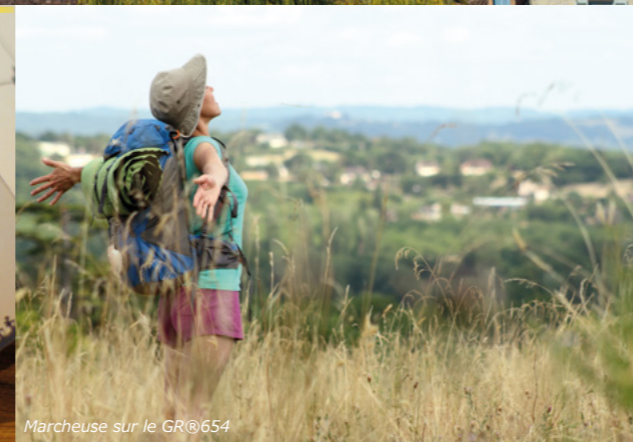
Marcheuse sur le GR®654