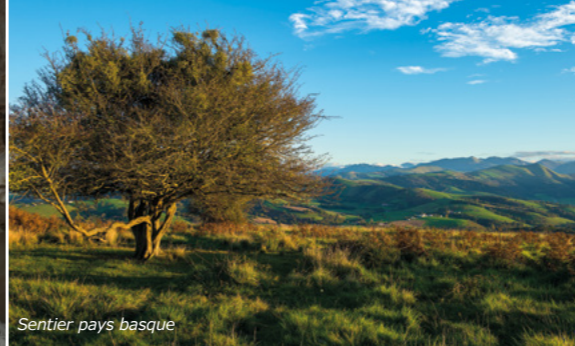
Sentier pays basque