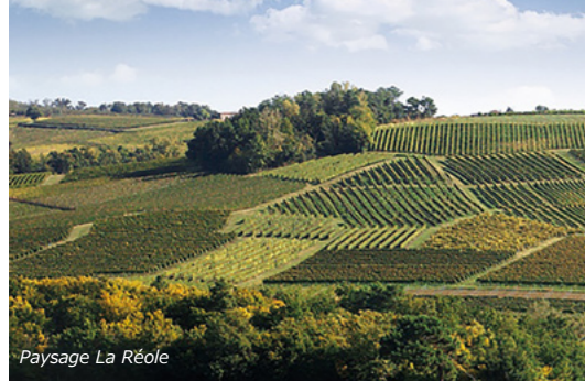
Paysage La Réole