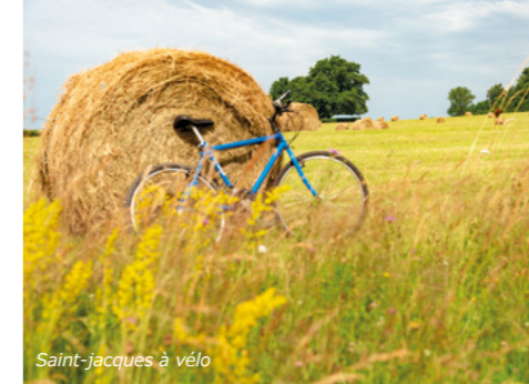
Saint-Jacques à vélo