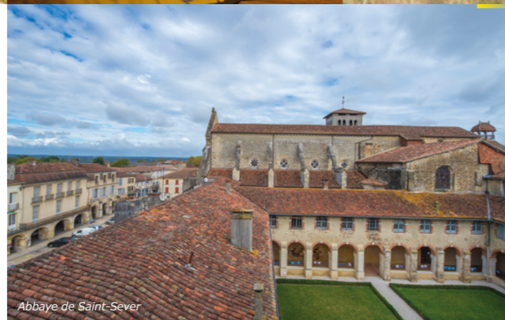
Abbaye de Saint-Sever