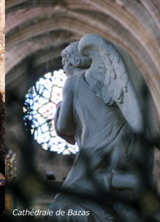
Cathédrale de Bazas