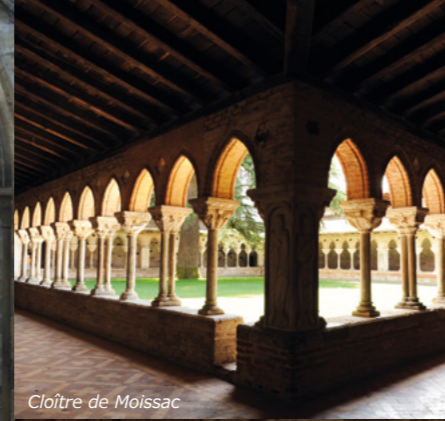
Cloître de Moissac