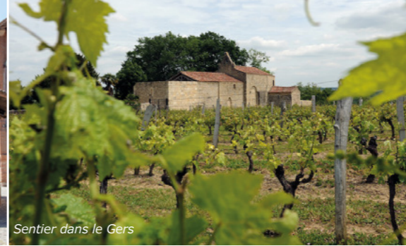
Sentier dans le Gers