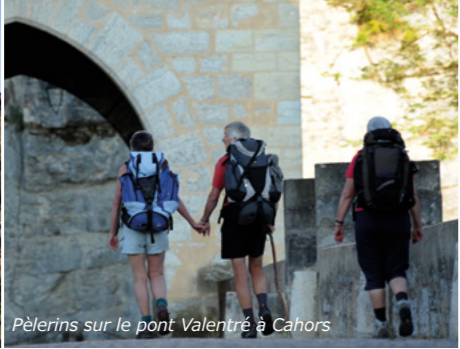
Pèlerins sur le pont Valentré à Cahors