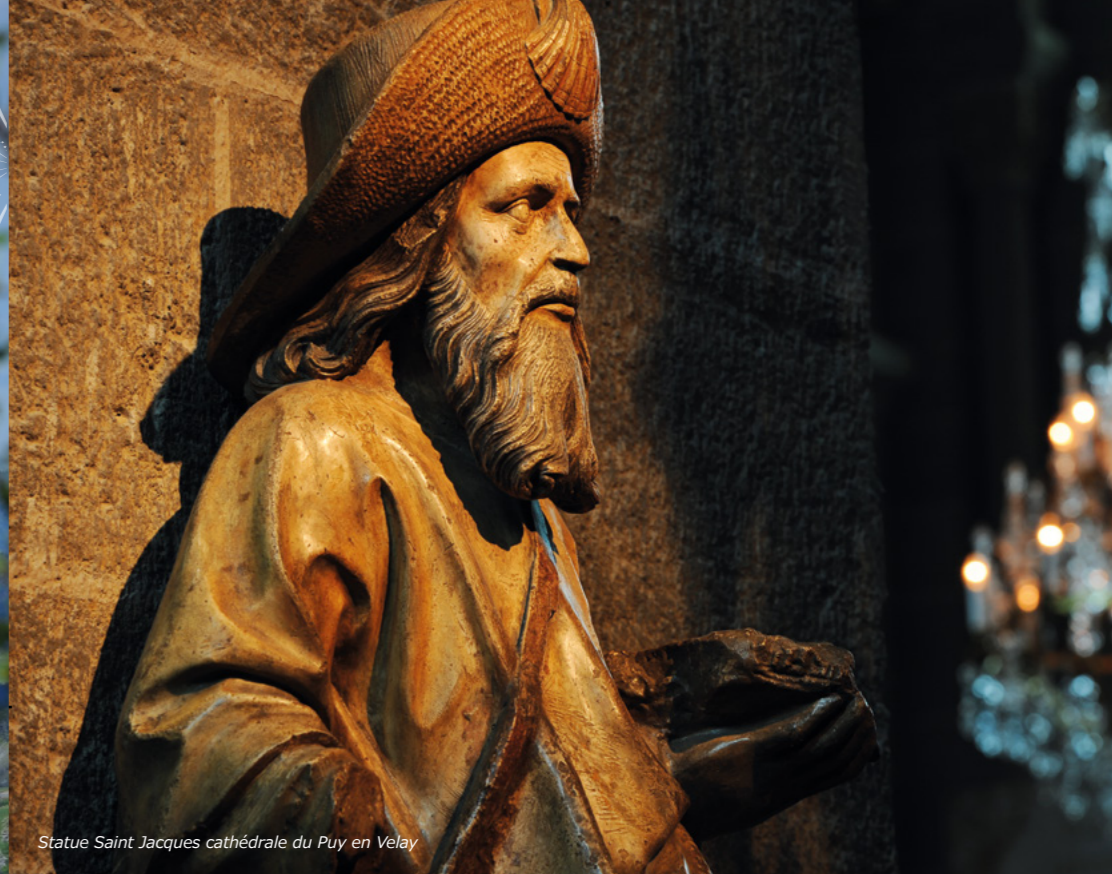
Statue Saint Jacques cathédrale du Puy en Velay