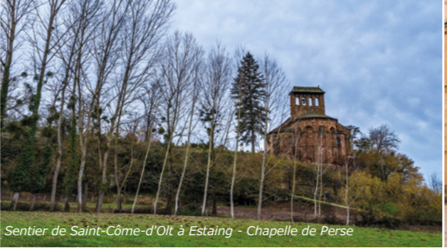
Sentier de Saint-Côme-d'Olt à Estaing - Chapelle de Perse