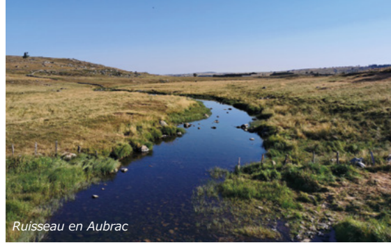
Ruisseau en Aubrac