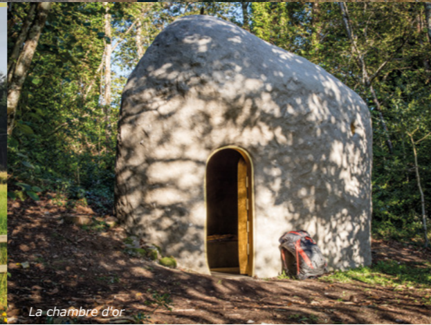
La chambre d'or